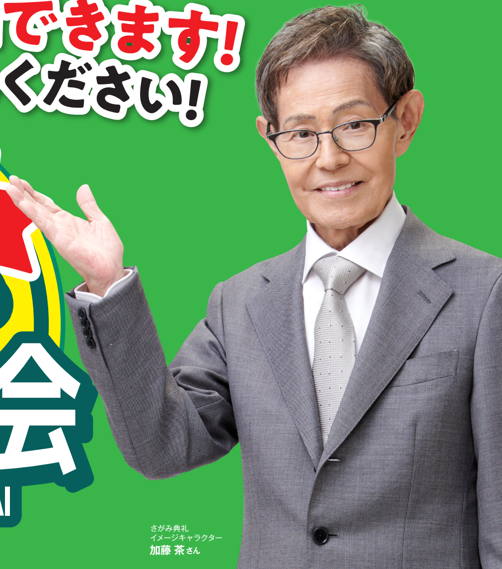
さがみ典礼 イメージキャラクター 加藤 茶さん