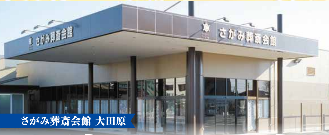
さがみ葬斎会館 大田原

来て、見て、聞いて! 大満足なフェア! 地域の皆様に感謝を込めて、心からのおもてなし。